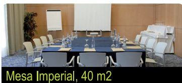
Mesa Imperial, 40 m2

www.hoteles-silken.com/hotel-puerta-madrid