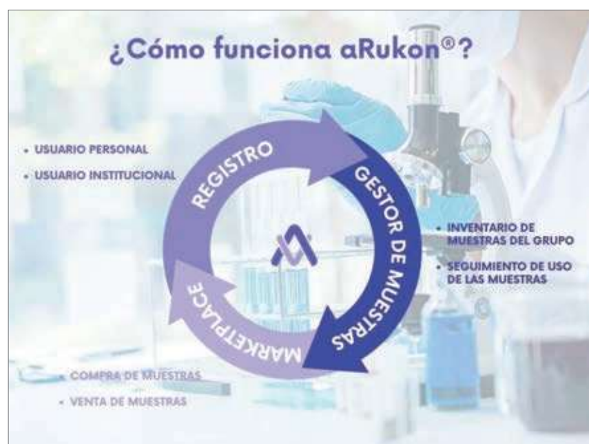
Figura 2: Diagrama que muestra la aplicación de los 3 pilares de aRukon® en la plataforma. A través del registro, los usuarios tienen acceso tanto al gestor de muestras como al marketplace que les permitirá la venta y adquisición de muestras.

3. Acceso abierto: Tanto los investigadores individuales como las instituciones pueden acceder a las herramientas de gestión de muestras, sin importar su afiliación institucional, lo que amplía las oportunidades de obtención de muestras, de colaboración entre entidades y de eficiencia en la gestión de laboratorios y centros de investigación.